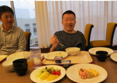
ホテルでの最後の朝食