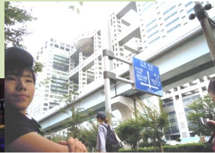
フジテレビやジョイポリスへ